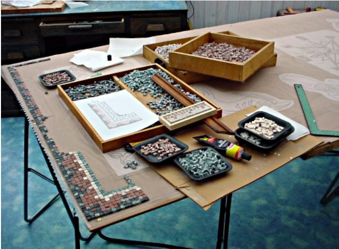
Illustration 1: pose de marbre

Cette méthode de réalisation directe a une source assez ancienne car on a retrouvé quelquefois sous le lit de mosaïque d'époque tardive romaine (notamment en Angleterre) des traces de toile de coton (tarlatane) qui pouvait peut-être servir déjà de support temporaire comme l'ont interprété quelques archéologues . A partir du début du XX ème s. une technique de pose directe sur toile de coton : tarlatane puis ensuite sur singalette fait son apparition. Le matériau employé a l'inconvénient d'être putrescible. Avec les technologies chimiques modernes et le carrelage industriel se prêtant volontiers aux exigences décoratives, le filet en fibre de