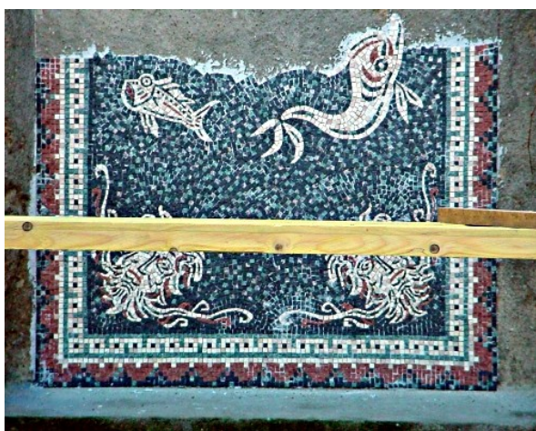
Illustration 4: Pose des découpes; mosaïque murale en marbre

Les dimensions exactes et le niveau (si pose murale) sont établis par mesure et crayonnage. Le support est préparé avec soin : nettoyage, apprêt éventuel... On repère le mouvement de pose des parties : on commence en général par le coin en haut à gauche; on colle la partie en évaluant la dimension (ne pas hésiter à déborder quelque peu... Préférable au manque de colle !), puis on prend le morceau verticalement et on l'applique soigneusement. Quelques tesselles peuvent alors se détacher car c'est la phase sensible de la manipulation ! Ce n'est pas grave ! Il faut juste les garder, repérer leur emplacement; il suffira ensuite de les remettre en place . On ajuste tout en faisant bien pénétrer le mortier.