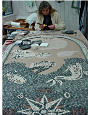
Illustration 2: en cours de pose

La tenue souple des tesselles sur le filet s'affranchit aussi d'une surface rigoureusement plane et autorise même l'envoi par colis avant la pose chez le commanditaire.